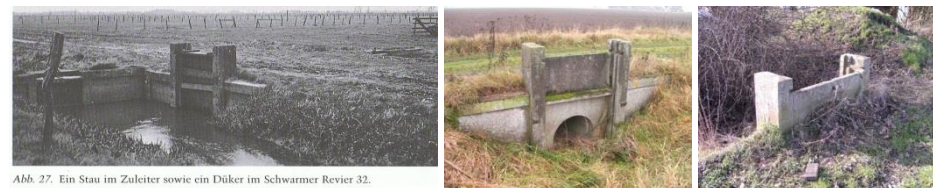
Abb. 27. Ein Stau im Zuleiter sowie ein Düker im Schwarmer Revier 32.

Ehemalige Schleusen im Schwarmer Bruch - Bewässerungstechnik